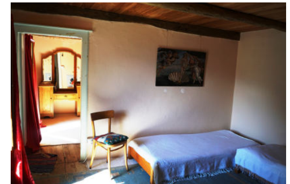
Bett zweifach, modern