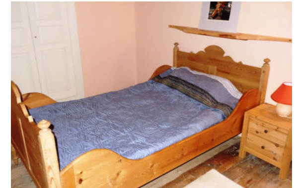
Bett eineinhalb, kuschelig