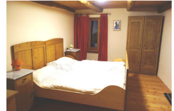
Bett zweifach, altmodisch